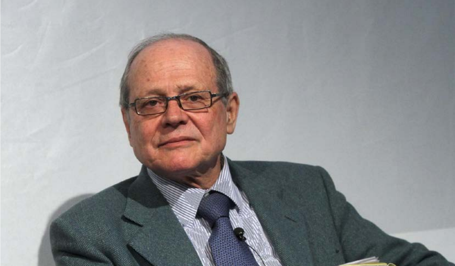
Il Presidente del CNEL Tiziano Treu

riforma fondamentale. Tra l'altro il Cnel ha fatto delle proposte in tale direzione, per esempio nel 2019 abbiamo presentato una proposta di legge per ridurre le procedure di sbarco delle merci alle dogane: i porti infatti hanno procedure talmente complicate che non si riesce a fare mai niente se non con tempi lunghi, ed è un collo di bottiglia significativo se si considera che la maggior parte delle merci arriva in Italia via mare».