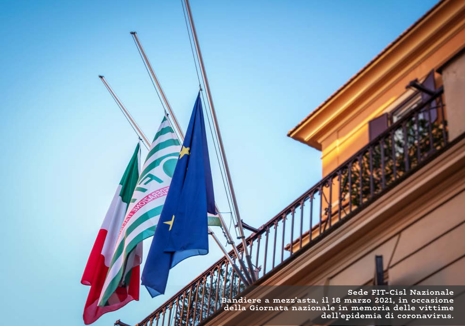
Sede FIT-Cisl Nazionale Bandiere a mezz'asta, il 18 marzo 2021, in occasione della Giornata nazionale in memoria delle vittime dell'epidemia di coronavirus.

solo sul piano sanitario: completare il piano di Figliuolo è propedeutico alla ripresa. In un contesto economico mondiale squassato dall'irruzione della pandemia, anche l'Italia sta pagando costi altissimi. Ma alcune categorie stanno sopportando il peso più di altre. Il rapporto Ipsos-Flair presentato al Cnel il 17 marzo racconta l'assottigliamento subito dal ceto medio: prima della pandemia costituiva il 40% della popolazione. Una percentuale ora scesa a quota 27. La paura e l'attesa sono i due sentimenti dominanti. È stato invece l'Istat, all'inizio di marzo, ad avvisare che nel 2020 un milione di persone in più ha fatto il proprio ingresso nella zona della povertà assoluta. Nel 2020 le famiglie in povertà assoluta sono oltre 2 milioni (il 7,7% del totale, +335mila), mentre il numero complessivo di individui che vivono questa triste condizione è pari a circa 5,6 milioni (9,4% contro il 7,7 dell'anno precedente).